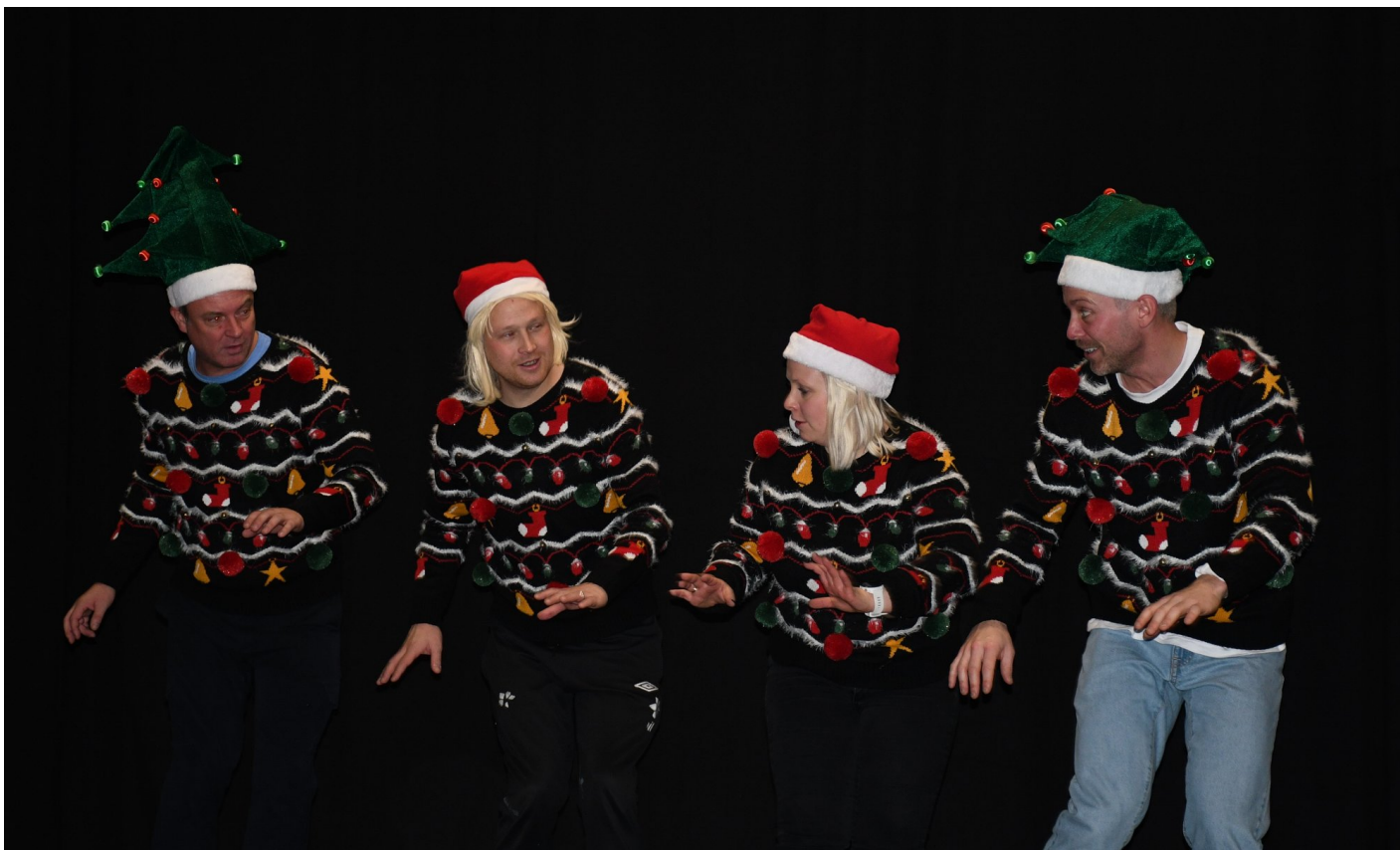
Gjengen i makrellrevyen gjør de siste forberedelsene til årets juleshow.

- Det er for alle, men litt drøy humor. Vi kan trekke ting ganske langt, og kødder med stereotyper og ting som skjer i livet. Det skal være sånn at folk kan komme hit og ta en pause fra alt julestress, le og få litt energi, sier Kvitstein.